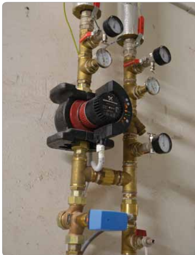
Obr. 3 Regulačná stanica s trojcestným ventilom

Smolenického zámku rozdelený na 11 zón, každá zóna bola osadená vlastným obehovým čerpadlom a trojcestným zmiešavacím ventilom, čo umožňuje riadiť teplotu obehového média pre každú zónu separátne. Týmto boli vytvorené v podstate samostatné regulačné stanice tepla pre každú jednu vetvu.