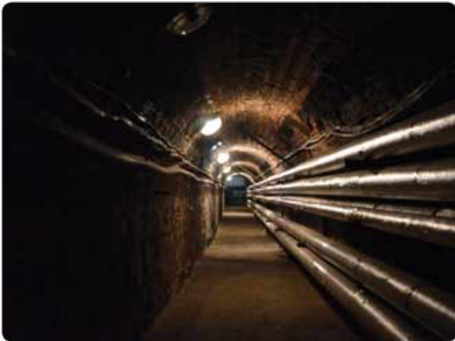
Obr. 5 Technologický tunel s rozvodmi v Smolenickom zámku

sústavy. Na jednotlivé vetvy rozvodov sa inštalovali vyvažovacie ventily, ktorých úlohou je dosiahnutie rovnakého pomeru zatekania teplotného média do jednotlivých vetiev vykurovania vzhľadom na výkon telies, ktoré sú na vetvu pripojené.