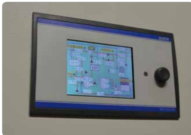
Obr. 4 Operátorský panel riadiaceho systému

Systém merania a regulácie je postavený na modulárnom regulátore Elesta. Jednotlivé regulačné stanice sú riadené z hlavného regulátora MaR, pokiaľ to dispozícia dovoľovala. Na miestach so sťaženým prístupom alebo vo veľkej vzdialenosti od hlavného regulátora bol nasadený podružný regulátor Elesta a bola vytvorená komunikačná sieť s hlavným regulátorom. Systém merania a regulácie je vybavený operátorským panelom s intuitívnym ovládaním. Stavové veličiny energetického zdroja, ako sú teplota, tlak a chod jednotlivých zariadení, možno prenášať na vzdialené dispečerské pracovisko bezdrôtovou sieťou založenou na štandarde GPRS. Je preto veľmi jednoduché v rámci vzdialeného dohľadu tento zdroj parametrizovať tak, aby jeho prevádzka bola čo najekonomickejšia pri zachovaní tepelnej pohody v celom zámku.