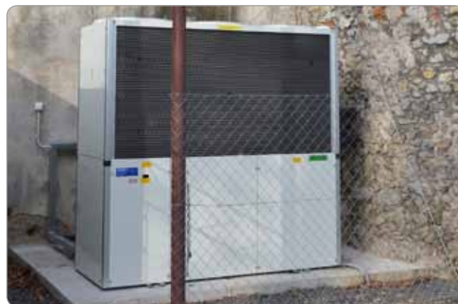
Obr. 1 Plynové tepelné čerpadlo na zámku Smolenice

Súčasťou kotolne je aj plynové tepelné čerpadlo AGXP 25 HP vzduch – voda s výkonom 80 kW.