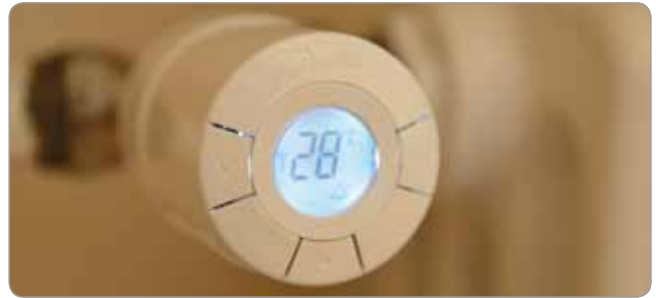
Obr. 6 Termostatická hlavica inštalovaná v priestoroch zámku Smolenice

V priestoroch, kde bola požiadavka na chladenie v letných mesiacoch, boli inštalované vodné fancoily, ktoré zabezpečujú chladenie aj vykurovanie podľa zvoleného režimu tepelného čerpadla na plynový pohon.